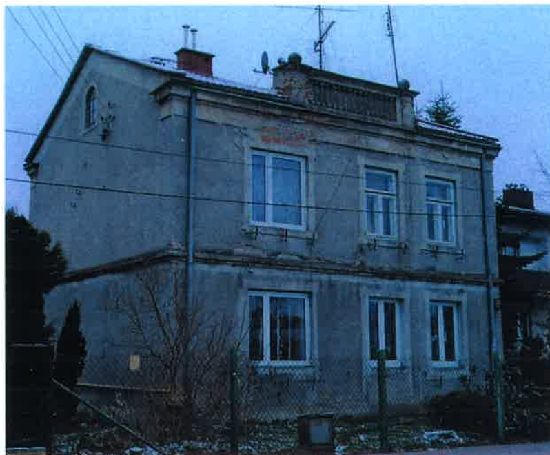
Fasada domu (elewacja północno-wschodnia).