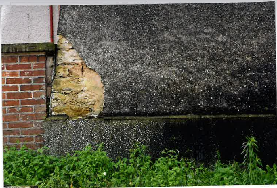
Fot. 5. Elewacja północna, destrukcja, 2020.