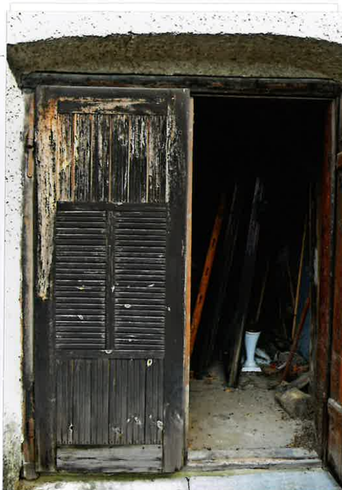
Fot. 3. Wejście do dzwonnicy, 2020.