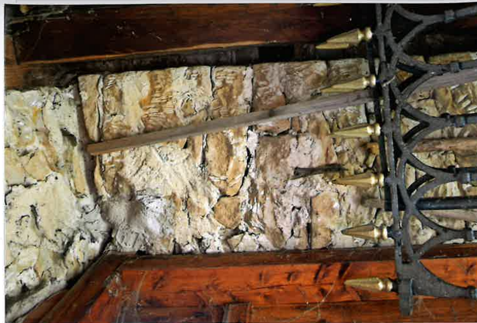
Fot. 6. Lico kamienne w ościeżu drzwiowym, 2020.