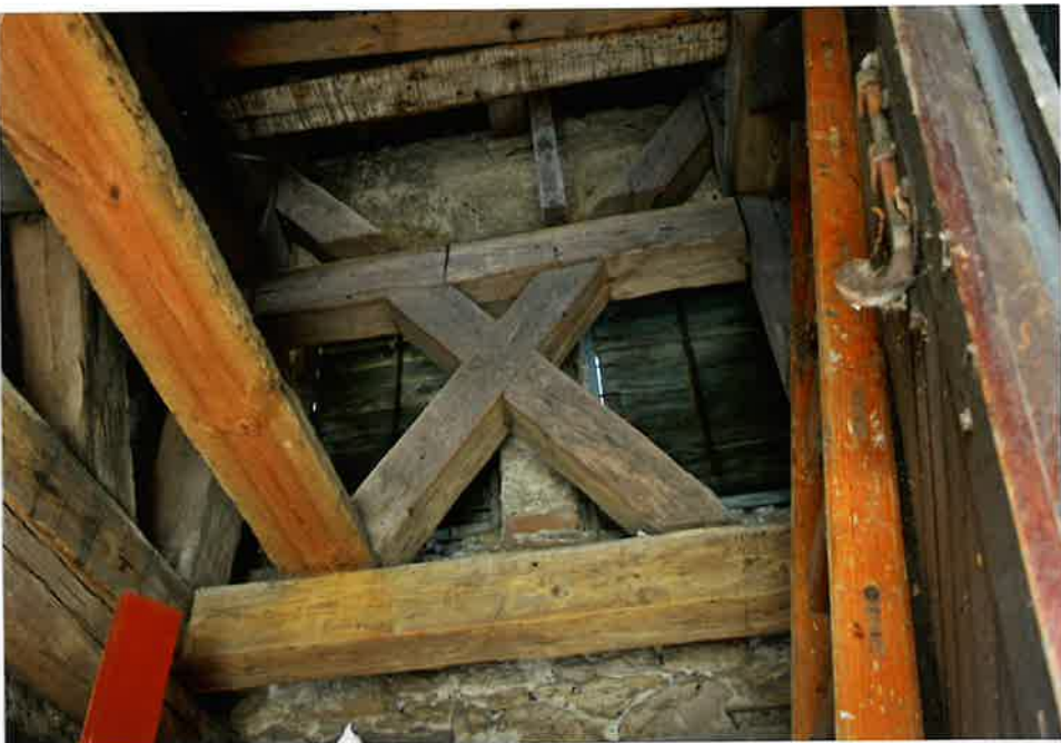
Fot. 7. Konstrukcja wsporcza dla dzwonów, 2020.