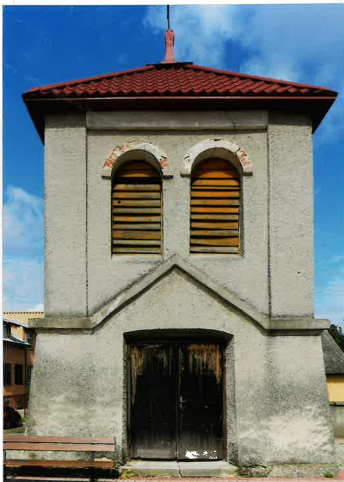
Fot. 2. Elewacja południowa, 2020.