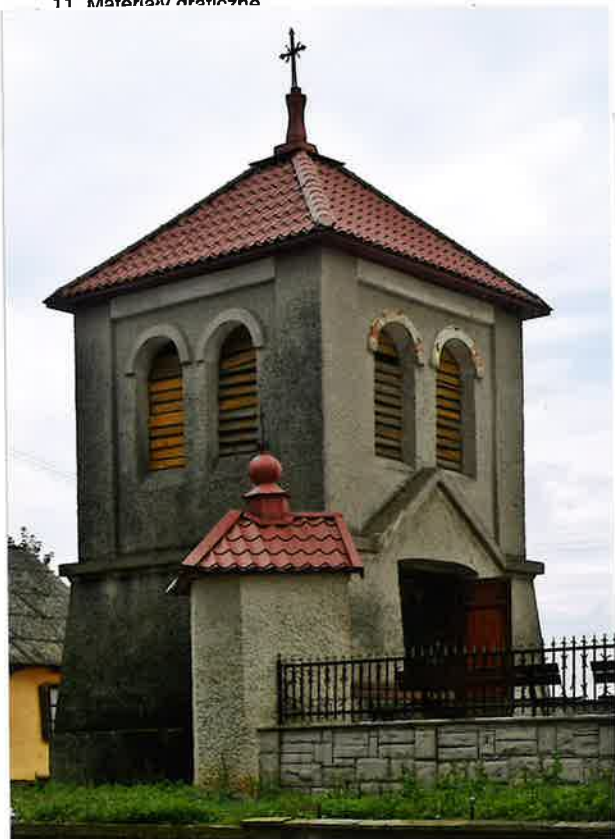
Fot. 1. Elewacje południowa i zachodnia z kaplicą w ogrodzeniu na pierwszym planie, 2020.