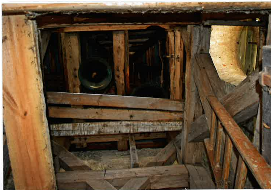
Fot. 8. Dzwony wraz z konstrukcją szkieletową, 2020.