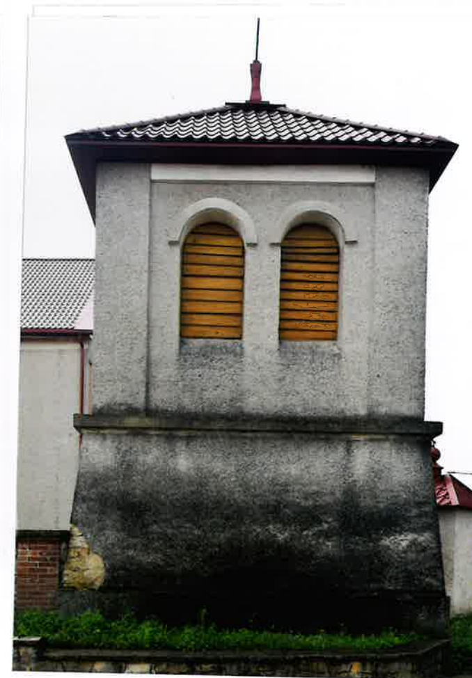
Fot. 4. Elewacja północna, 2020.