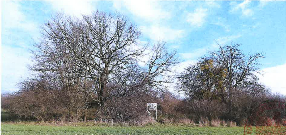
Widok na cmentarz od strony zachodniej

Załącznik graficzny nr 2 do decyzji MWKZ nr 55 /2026 z dnia 13-04-2026 wpisującej do rejestru zabytków nieruchomości województwa mazowieckiego cmentarz wojenny z I wojny światowej „Marynin” z lat 1915-1918, położony w Konstancinie-Jeziornie, gm. loco, pow. piaseczyński (dz. ew. nr 86 obr. 0015 (Obory-Łyczyn).