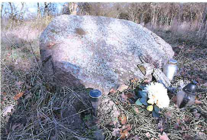
Rosyjskie i niemieckie nagrobki, centralny kamień na środku cmentarza

MAZOWIECKI WOJEWÓDZKI KONSERWATOR ZABYTKÓW