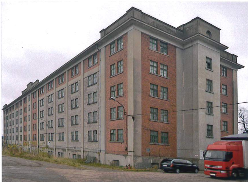
Fot. 1. Elewacja zachodnia (od dziedzińca) i elewacja północna (powyżej).