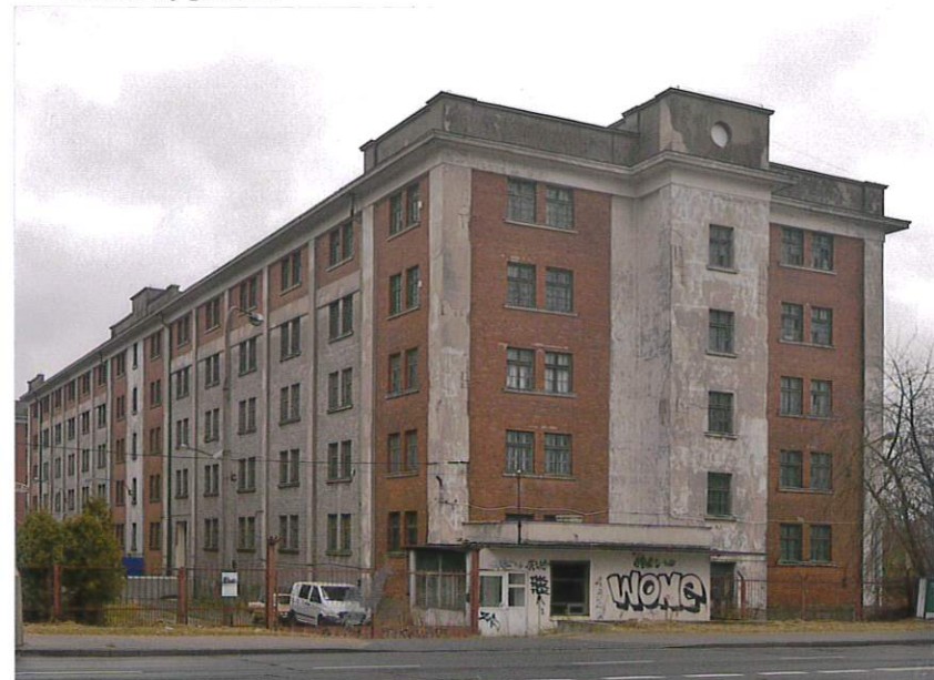
Fot. 1. Elewacja zachodnia (od ul. Wierzbickiej) i północna (powyżej).