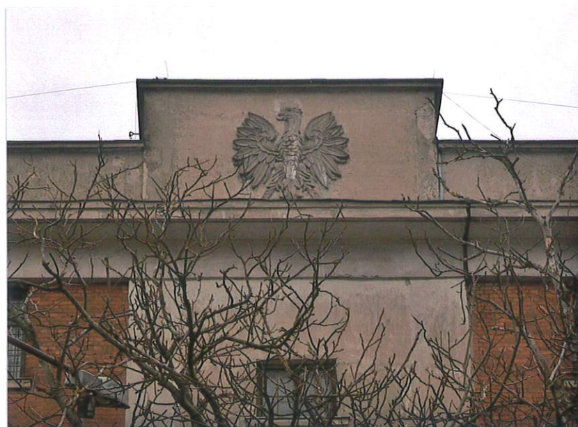
Fot. 2. Fragment środkowego ryzalitu elewacji południowej (po prawej).