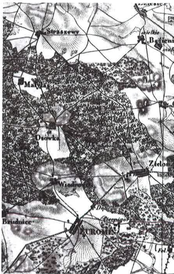
2. Wycinek z mapy Kwatermistrzostwa z W.P. z ok. 1830 r.