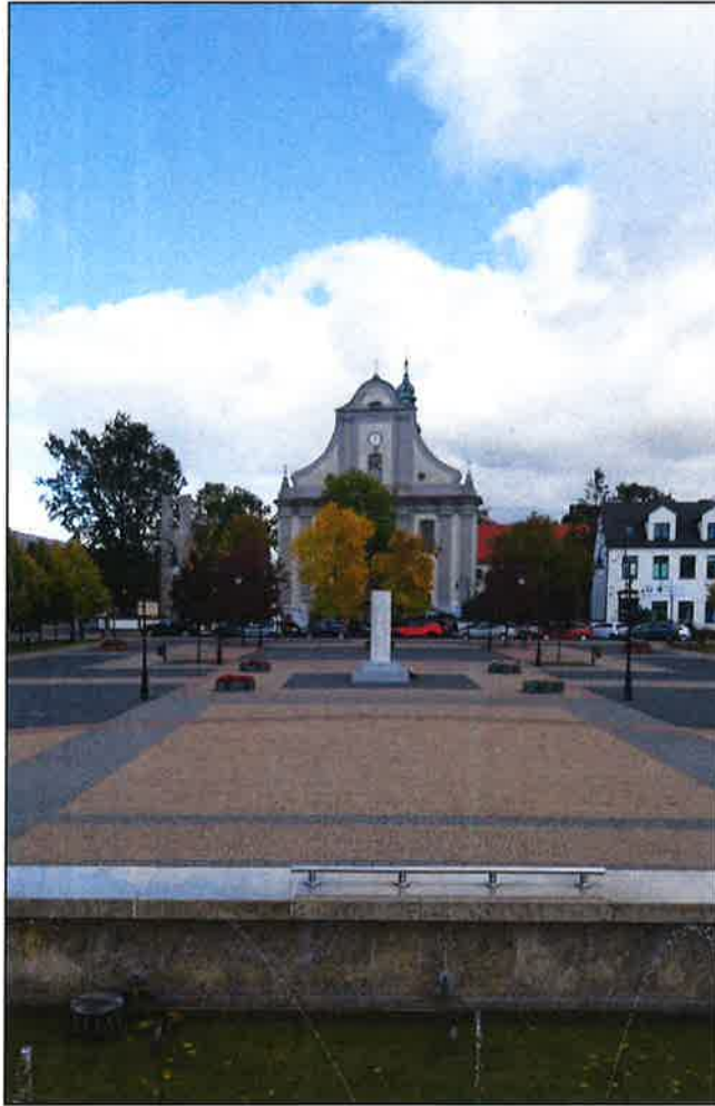
1. Widok na północno-wschodnią część rynku