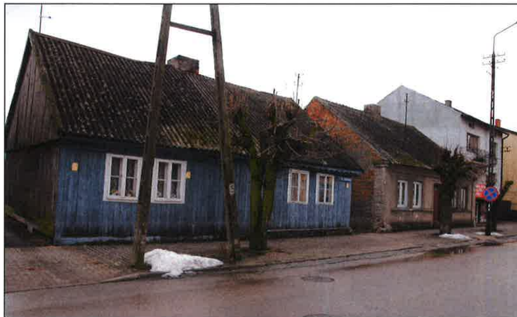
4. Zabudowa ul. Kościuszki.

Opracowanie załącznika: (data i podpis) 04.11.2022 r.