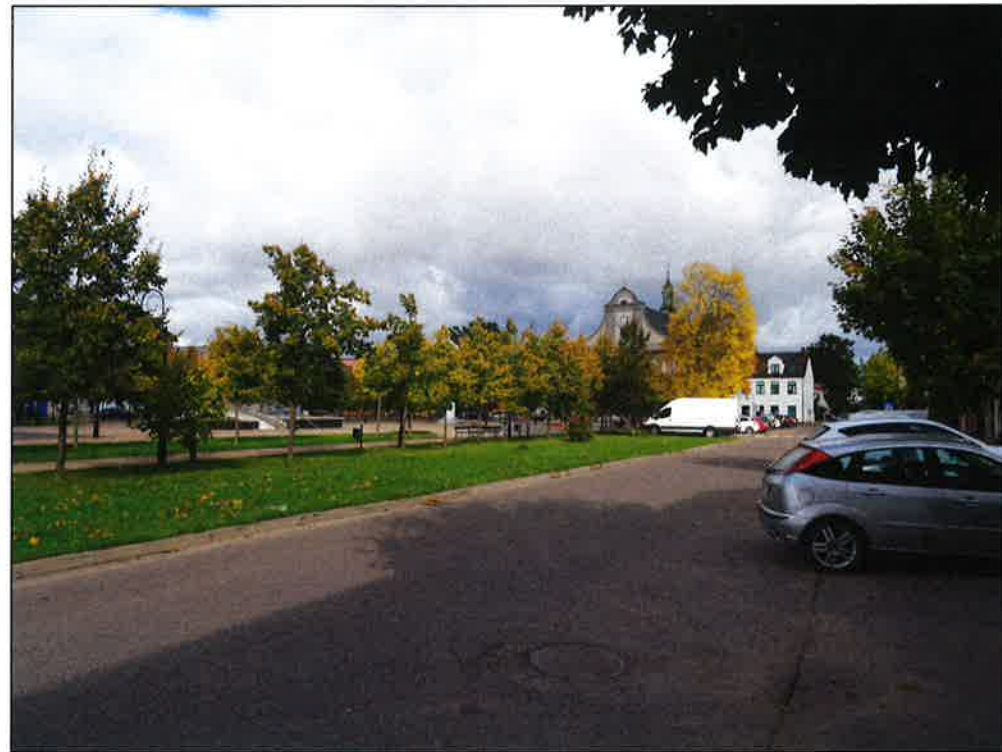
2. Widok na pierzeję wschodnią rynku.